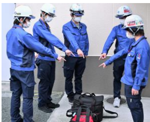
ツールボックスミーティング

向洋電機では安全を第一に現地調整作業を行っています。 日々のツールボックスミーティング、危険予知活動の他に安全衛生教育、現場パトロールを実施し、作業員全員での安全意識の高揚を図っています。